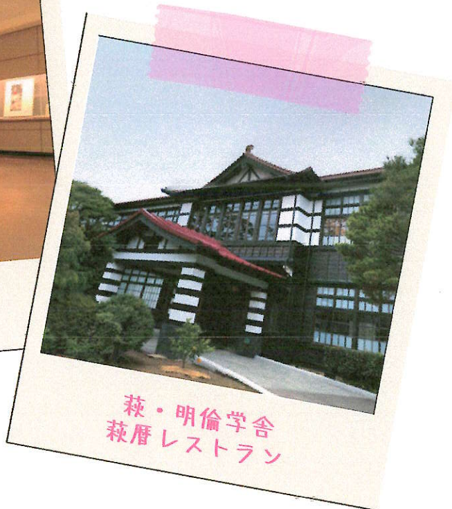
萩・明倫学舎 萩暦レストラン