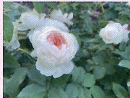
ステファニーグッテンベルク

また、秋の開花が楽しめる四季咲き性のバラは、8月下旬から9月中旬までに夏剪定を行い、秋の開花の準備をしましょう。目安としては、樹高の2/3から3/4位の位置まで切り戻しましょう。