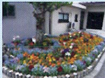
テクノ UMG 株式会社