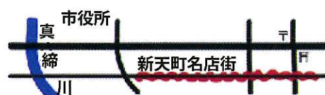
新天町名店街位置図