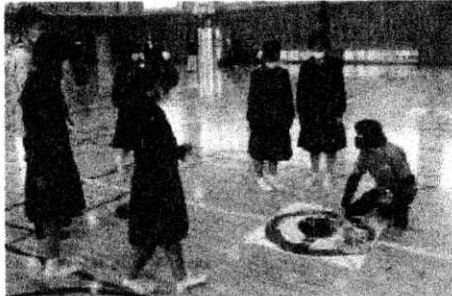
〈カラーリング教室〉