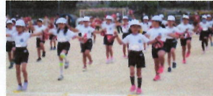
2年 全集中!きらめきダンス