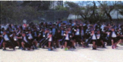
5年 上宇部ソーラン