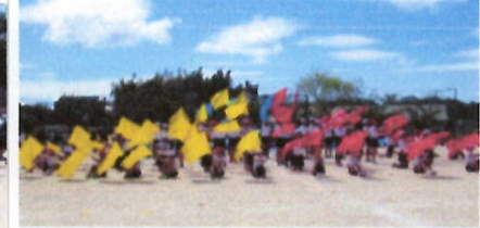
6年 つながりの力~掲げた旗に思いをのせて