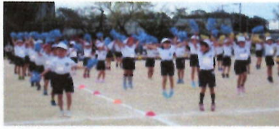
1年 いっしょに笑おう!~笑一笑~