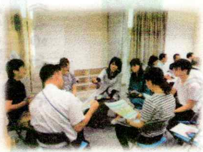
<地域の方々と教職員(小中)の交流>

学校・家庭・地域との協働により、子どもの9年間の学びと15年間の育ちを支え、 上宇部地区 琴芝地区の確かな未来を創造していきましょう。