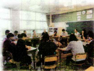
<教職員同士の交流>